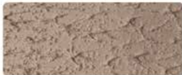
شيلد تكس سلك