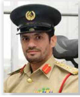
العميد محمد عبدالله المعلا

وعن خططهم المستقبلية، كشف عن أن فريق الاستراتيجية يقوم حالياً بتحليل البيئة الداخلية والخارجية، ودراسة التحديات العالمية على العمل الأمني، وذلك من خلال تحليل تقارير التنافسية والاطلاع على أفضل الممارسات العالمية، وبناء على ذلك ستحدد المختبرات الاستراتيجية لعام 2020، مع استمرار التركيز على التكامل مع الشركاء في تحقيق الأمن.