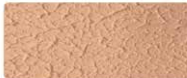
شيلد فاين سلك