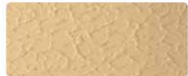
شيلد الترا سلك

هاتف: +٩٧١ ٦ ٥١٣٠٠٠٠، فاكس: +٩٧١ ٦ ٥٣٤٠٢٢٢، ص.ب: ٥٨٢٢، الشارقة - إ.ع.م.