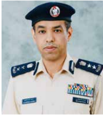
العقيد الدكتور حمود سعيد العفاري مدير إدارة الشرطة المجتمعية - شرطة أبوظبي