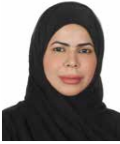
فاطمة المزروعي - أديبة إماراتية