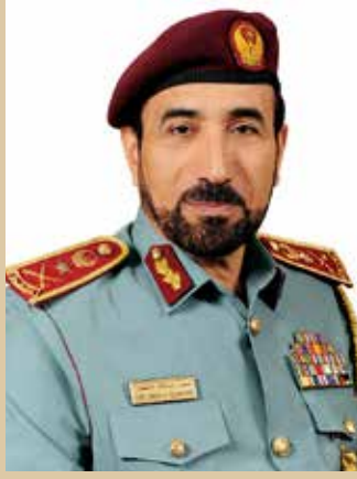
الفريق سيف الشعفار

وتناولت الورشة مفهوم المرونة والرشاقة المؤسسية، وأهميتها في تجاوز التحديات التي تواجه العمل الحكومي، ومرونة الإجراءات واتخاذ القرارات السريعة، وقدرة منظومة العمل على سرعة الاستجابة للمتغيرات والتكيف معها، مع الحفاظ على المتطلبات الأساسية في جودة العمل واستمرارية الأعمال والدقة والدور الرقابي والحوكمة وتعزيز جودة الحياة للمجتمع الإماراتي. إلى ذلك، ناقش الاجتماع الذي عقده الإدارة العامة لمكافحة المخدرات الاتحادية في وزارة الداخلية عبر تقنية الاتصال المرئي عن بُعد، مستجداً تهريب المخدرات والاتجار بها، والتحديات المتوقعة في ظل الإجراءات الاحترازية والوقائية المتخذة من قبل السلطات المعنية في دولة الإمارات العربية المتحدة لمواجهة انتشار وباء «كورونا»، والمتمثلة في تقييد حركة السفر والطيران، وفرض قيود على دخول الوسائل البحرية الخشبية إلى الدولة. وشارك في الاجتماع ممثلون عن مديرات وإدارات مكافحة المخدرات في القيادات العامة للشرطة بالدولة والهيئة الاتحادية للجمارك، ودوائر الجمارك المحلية، وجهاز حماية المنشآت الحيوية والسواحل في أبوظبي.