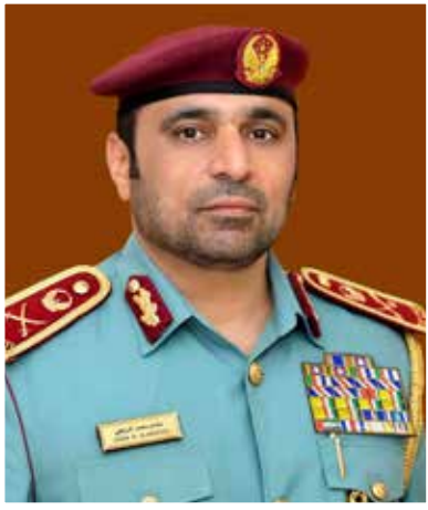
اللواء جاسم المرزوقي

أكد سعادة اللواء الدكتور جاسم محمد المرزوقي قائد عام الدفاع المدني في وزارة الداخلية في حوار خاص مع «مجتمع الشرطة» العمل وفق التوجيهات الحثيثة والمتابعة الدؤوبة للضريق سمو الشيخ سيف بن زايد آل نهيان نائب رئيس مجلس الوزراء وزير الداخلية باتخاذ جميع الإجراءات الوقائية في السعي لحماية الأرواح والممتلكات، وأن الدفاع المدني في دولة الإمارات العربية المتحدة هو على أعلى مستوى من الجاهزية والاستعداد لمواجهة الحوادث والأزمات والكوارث، مع حرصه الدائم على التوظيف الأمثل للتقنيات الحديثة وتدريب القوى البشرية.