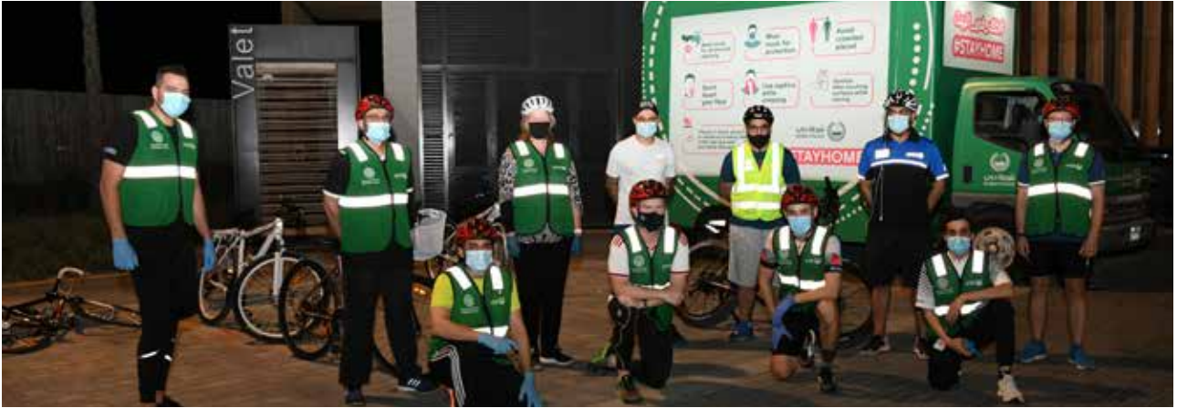
مشاركون في المبادرة الرياضية التوعوية

نظم عدد من القيادات العامة للشرطة في دولة الإمارات العربية المتحدة خلال الشهر الماضي فعاليات رياضية وتوعوية مع الالتزام بالإجراءات الوقائية والاحترازية للحد من انتشار وباء «كورونا»، والحفاظ على صحة وسلامة المشاركين في هذه الفعاليات من منتسبي الشرطة وأفراد المجتمع مواطنين ومقيمين.