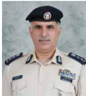
العقيد عصام آل علي

وضمن الفرق النسائية المشاركة في هذه البطولة، فاز فريق قطاع الموارد البشرية بالمركز الأول، وحصل على المركز الثاني فريق قطاع المهام الخاصة، وجاء ثالثاً فريق قطاع شؤون الأمن والمنافذ. وأشاد العقيد عصام عبدالله آل علي مدير مركز التربية الرياضية الشرطية في القيادة العامة لشرطة أبوظبي ورئيس اللجنة المنظمة للبطولة بالمستوى المتميز للمشاركين فيها، وبأهمية هذه المنافسات للمنتسبين والمنتسبات، والتي أقيمت عن بعد من البيت نظراً للظروف الراهنة مع تطبيق الإجراءات الوقائية والاحترازية التي تنتهجها الدولة للتصدي لوباء «كورونا».