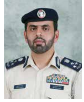
العميد سهيل الخيلي

مبادرة درب السلامة للتوعية المرورية التي تواصل القيادة العامة لشرطة أبوظبي تنفيذها بأنها «ظاهرة حضارية» لما لها من أهمية اجتماعية وتربوية وتوعوية، من خلال التفاعل التوعوي للشرطة مقروناً باستخدام التقنيات الحديثة ونظم البرمجة المرورية المتطورة ومشاركة آلاف المتطوعين، وكل ذلك بهدف الحفاظ على أرواح الناس، وتقليل الخسائر البشرية والمادية، وزيادة الوعي بأهمية العمل المروري القائم على مدار الساعة. وأضاف: أن هذه المبادرة هي بالفعل تجربة رائدة تستحق الإشادة والتقدير، لأنها عكست روح الطمأنينة والأمل بين الناس، وأشاعت جو المحبة بينهم وبين رجال الشرطة، وهذه المبادرة ليست بجديدة على القيادة العامة لشرطة أبوظبي التي عودتنا دائماً على الإسهامات والمبادرات الحيوية والنهضوية، وبمشاركة مختلف دوائر ومؤسسات الدولة فضلاً عن المواطنين والمقيمين.