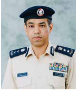
العقيد الدكتور حمود سعيد العفاري مدير إدارة الشرطة المجتمعية - شرطة أبوظبي