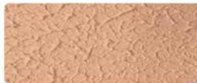
شيلد فاين سلك