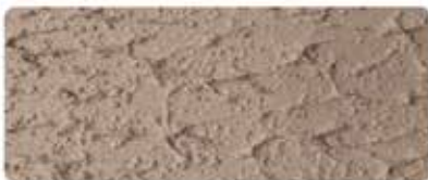
شيلد تكس سلك