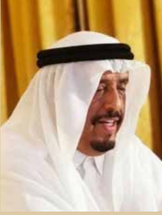
الفريق ضاحي خلفان تميم

وذلك بحضور سعادة اللواء الدكتور أحمد ناصر الريسي مفتش عام وزارة الداخلية.