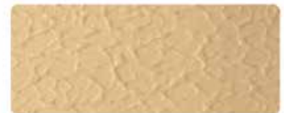
شيلد الترا سلك

هاتف: +٩٧١ ٦ ٥١٣٠٠٠٠، فاكس: +٩٧١ ٦ ٥٣٤٠٢٢٢، ص.ب: ٥٨٢٢، الشارقة - إ.ع.م.