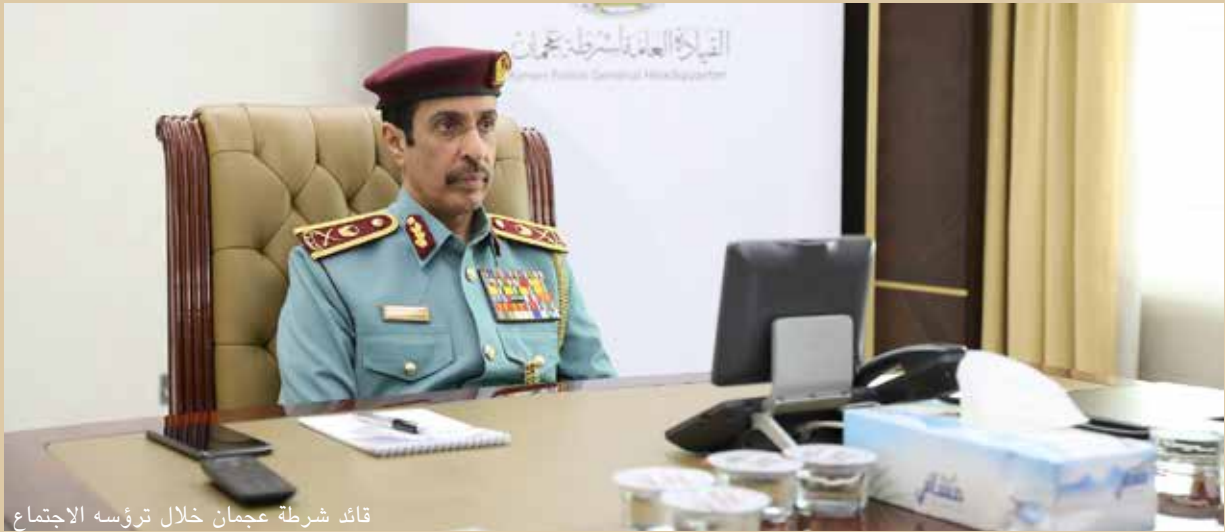
قائد شرطة عجمان خلال ترؤسه الاجتماع